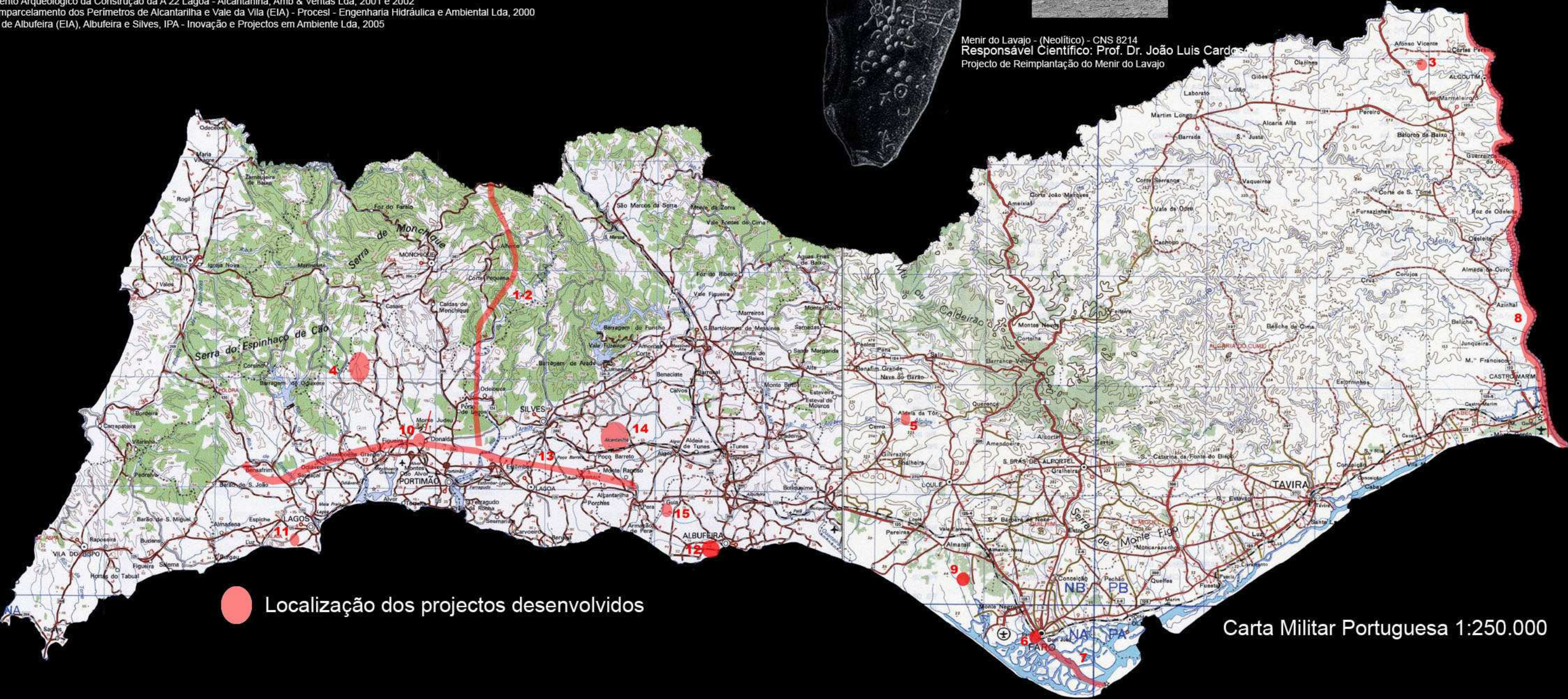
Localização dos projectos desenvolvidos