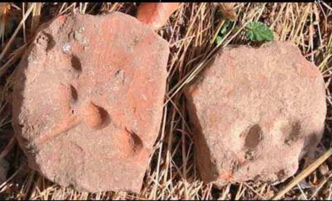
Malhas de Jogo, ( Medieval/Moderno ) - CNS 10312 EIA Projecto de Ampliação da Pedreira de Milhanes