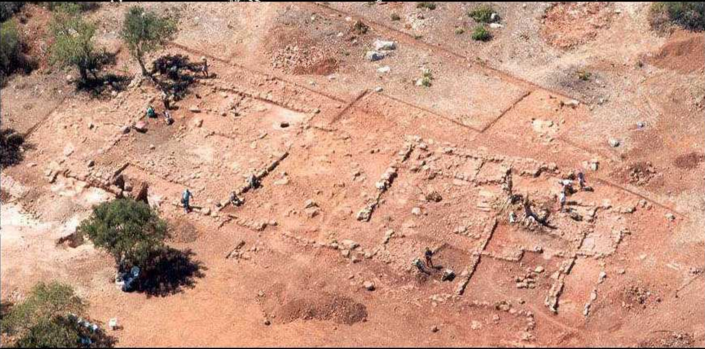
Alcarnia de Arge ( Islâmico ) - CNS 16925 Responsável Científico: Dr. Armando Sabrosa Acompanhamento Arqueológico da Construção da A 22