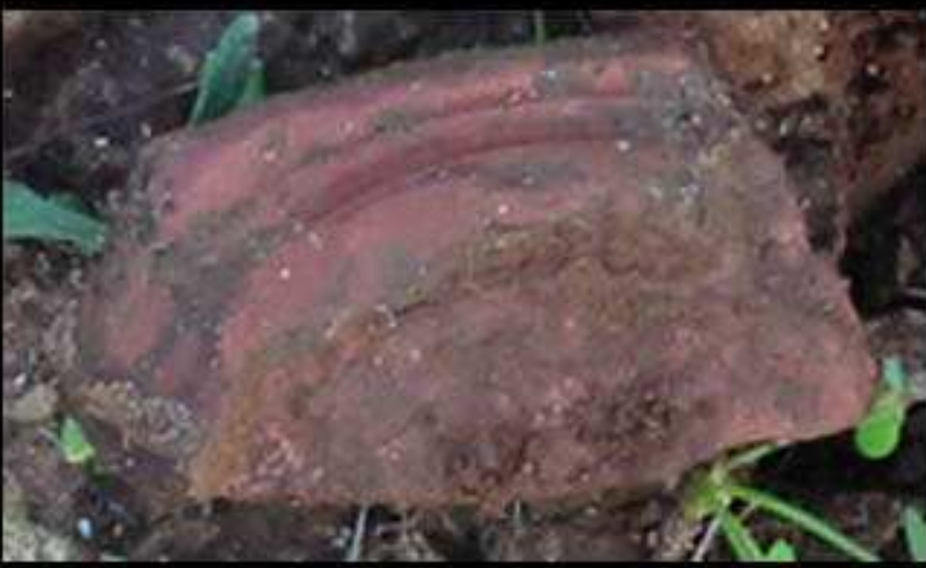
Fragmento de Terra Sigillata Quinta da Donalda - ( Romano ) EIA Hotel - Campo de Golfe na Quinta das Donas