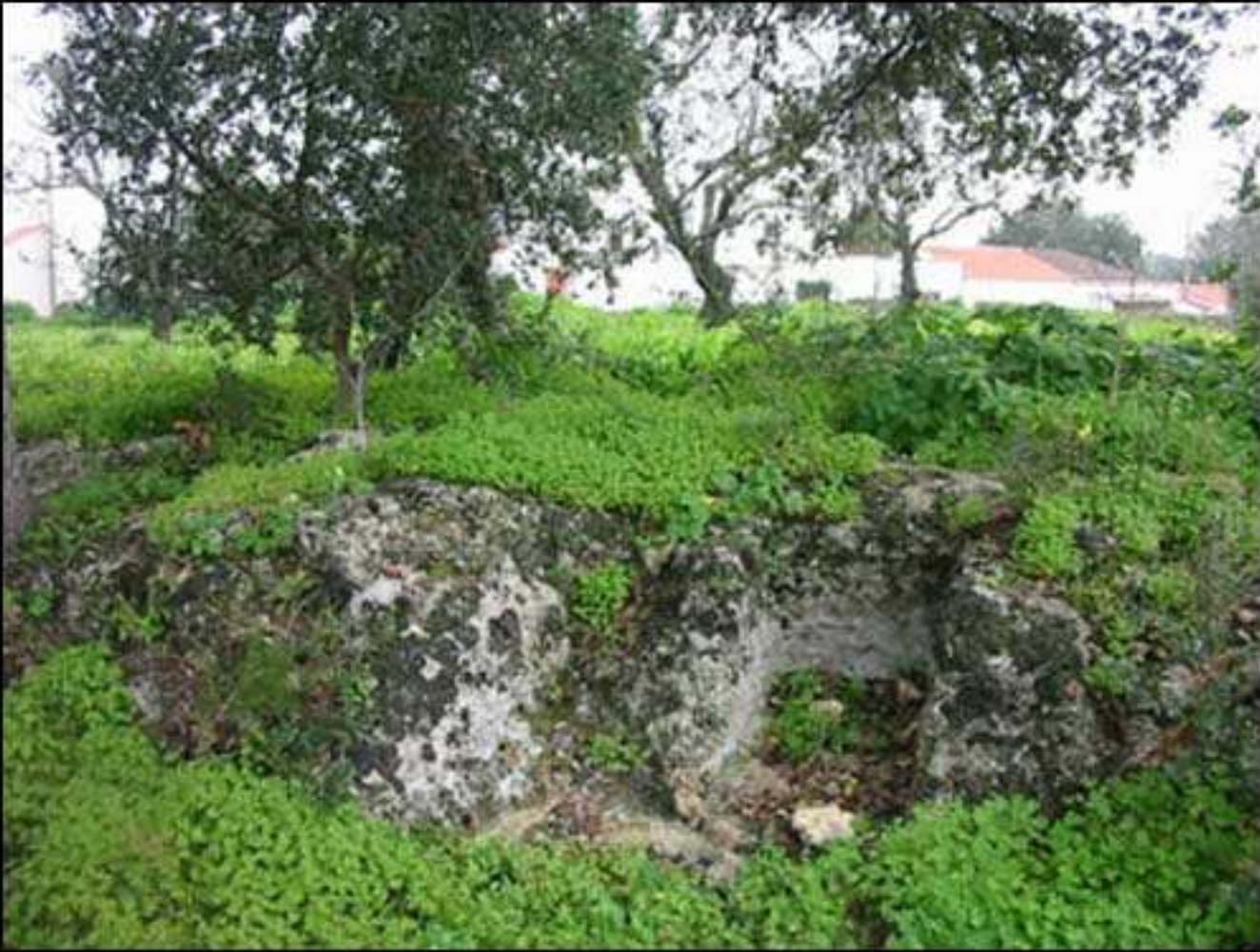
Necrópole Medieval de Alfaroibeiras - CNS 6798 EIA Hotel - Campo de Golfe na Quinta das Donas